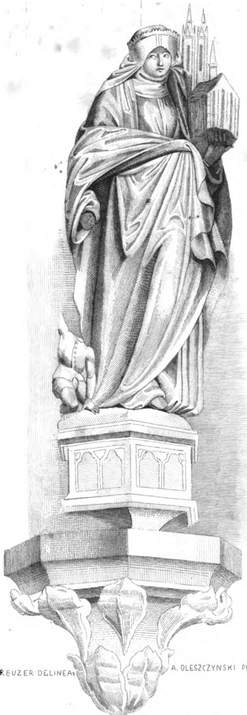
STATUE DE SAINTE ELISABETH DANS L'ÉGLISE DE SON NOM A MARBOURG